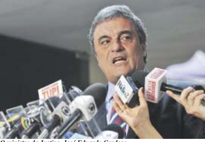
O ministro da Justiça, José Eduardo Cardozo

O ministro da Justiça, José Eduardo Cardozo, disse que o governo quer tornar mais severa a lei seca no trânsito. O governo pretende unificar projetos de leis diferentes que tramitam no Congresso Nacional. “A lei (atual) é boa, mas é necessário superar problemas que possam alimentar a sensação de impunidade. A nossa ideia é modificar a lei para que a sensação de impunidade que volta novamente fa-