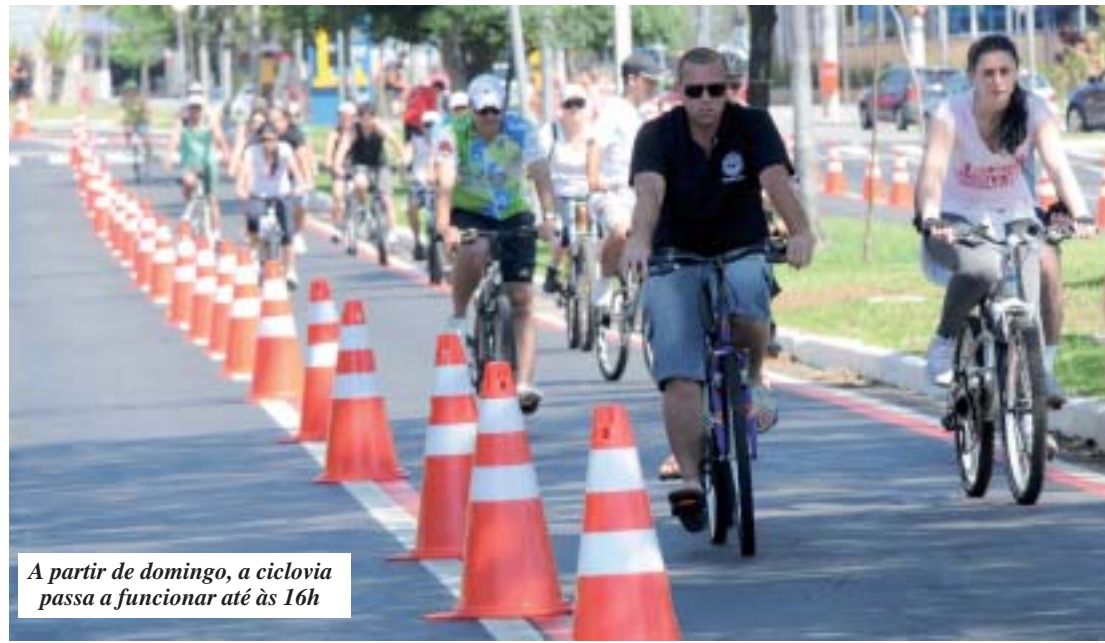
A partir de domingo, a ciclovia passa a funcionar até às 16h

Ao que nos parece as mentiras continuam, são horas, dinheiro público e espaços na mídia sendo gastos com falsários, que em nada acrescentam para melhorar a nossa vida.