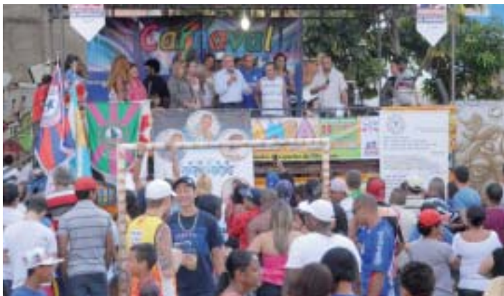
O evento é organizado pela Liesg em parceria com a Prefeitura de Guarulhos

Já esquentando os tamborins rumo ao Carnaval deste ano, a Escola de Samba Unidos da Vila Tijuco mostrou um