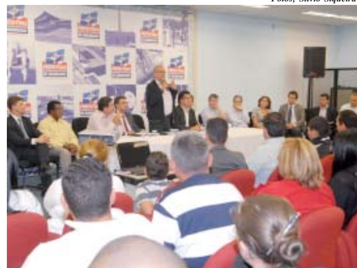
Cerca de 150 empreendedores receberam a licença

O atendimento é gratuito através do Fácil Empresarial, situado à avenida Emílio Ri-