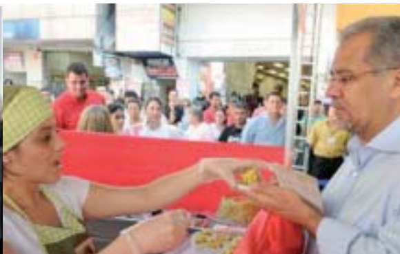
No calçadão da D. Pedro Almeida saboreia as delícias do Projeto Saúde com Casca