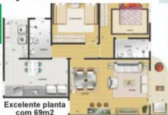
Excelente planta com 69m2

(011) 2452-5623 / (011) 2773-3588 / (011) 6707-9090 ID 80*184533 ID118*20365 / (011) 7161-7741 (011) 6399-3824