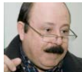
Levy Fidelix (PRTB)