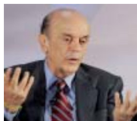
José Serra (PSDB)