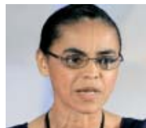
Marina Silva (PV)