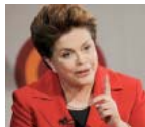
Dilma Rousseff (PT)